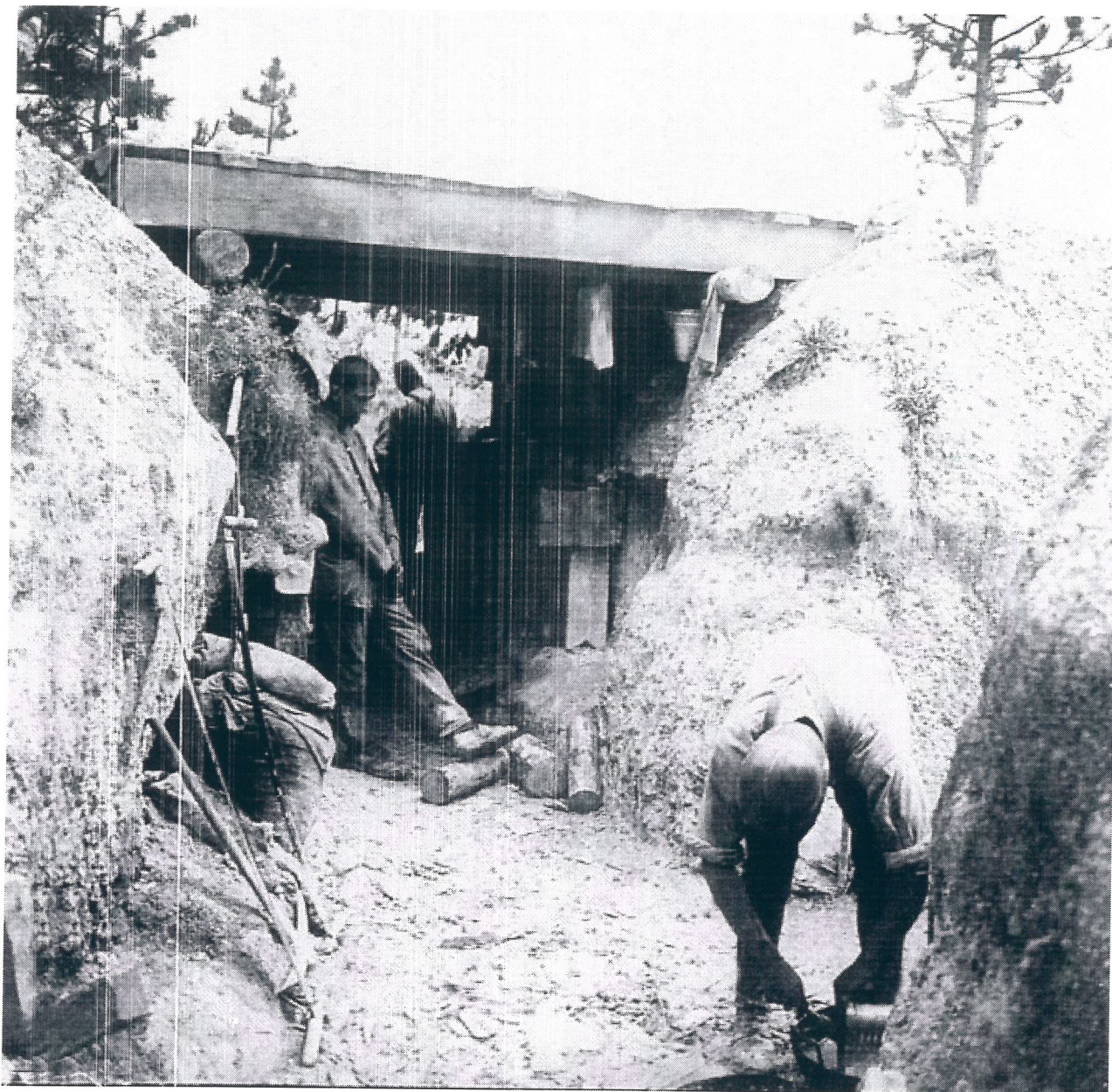
Dans les tranchées de Suippes (Marne)