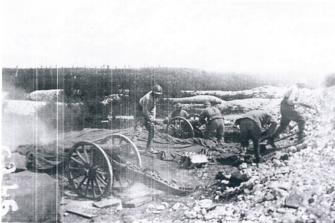
Batterie de canons - bois d'Avocourt dans la Meuse