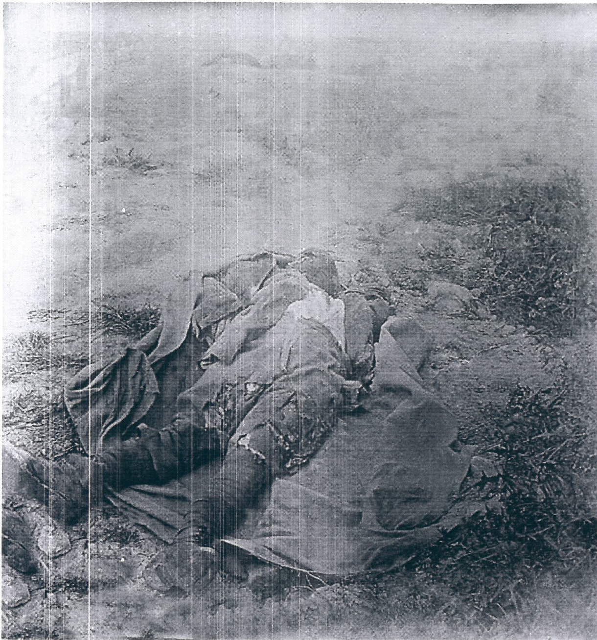
Cadavre de soldat à Avocourt (Meuse)